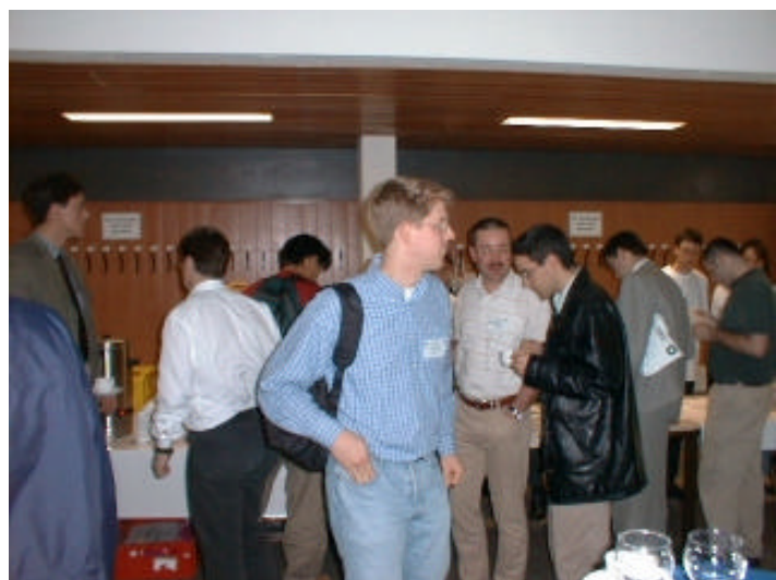
In der Pause

Der diesjährige Workshop in Karlsruhe war sehr erfolgreich. So konnte mit knapp 150 eingereichten Beiträgen von renommierten For-